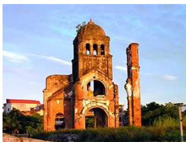
Ruiny budynku kościoła Tam Toa

Rankiem 20 lipca ponad 100 milicjantów i funkcjonariuszy służby bezpieczeństwa zaatakowało chrześcijan w Dong Hoi, stolicy wietnamskiej prowincji Quang Binh. Około 150 katolików z parafii Tam Toa było zgromadzonych na terenie kościelnym w celu zbudowania prowizorycznego miejsca zgromadzeń, kiedy przyjechała służba bezpieczeństwa i zaatakowała ich, używając gazu łzawiącego, pałek, kijów i broni ogluszającej. Ponad 20 osób zostało rannych, a kilkadziesiąt aresztowano. Z działki zabrano krzyż, materiały budowlane i dwa generatory. Skonfiskowano też kamery i odtwarzacze wideo.