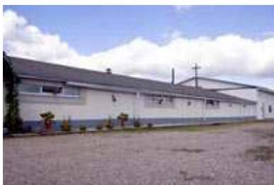
Budynek kościoła Nowe Życie

Forum18 donosi o trwających w dalszym ciągu naciskach władz na wiernych z nie zarejestrowanego zboru Nowe Życie Pełnej Ewangelii z Mińska w sprawie ich budynku kościelnego. W poprzednich latach pastor wspólnoty zapłacił ogromną grzywnę, a wiernym nakazano sprzedaż budynku nabytego w 2002 r. i klasyfikowanego w świetle obowiązujących przepisów jako obora. 14 sierpnia poinformowano wiernych, że w zamian za odszkodowanie w wysokości 37 581 476 rubli białoruskich (około 37 600 zł) muszą opuścić budynek kościelny do dnia 20 sierpnia. Chrześcijanie złożyli skargę, gdyż przyznana kwota odszkodowania jest dużo niższa niż faktyczna wartość nieruchomości i zwrócili pieniądze. Taka sytuacja miała miejsce już po raz trzeci. 22 sierpnia otrzymali następny dokument, w którym nakazano im przekazanie budynku władzom.