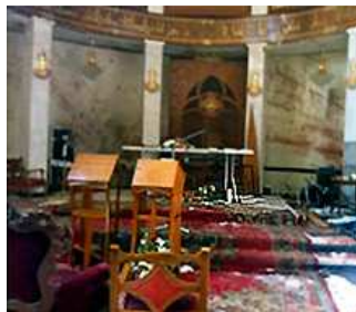
Budynek kościoła po ataku

31 października islamscy bojówkarze napadli podczas mszy na katedrę kościoła katolickiego obrządku syryjskiego w Bagdadzie. Mężczyźni uzbrojeni w broń automatyczną oraz materiały wybuchowe wtargnęli do budynku kościoła, żądając wypuszczenia irańskich muzułmanek, rzekomo przetrzy-