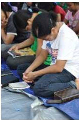
Studenci jednej ze szkół biblijnych w Indonezji

W Jonggol, w Jawie Zachodniej, doszło w czerwcu do ataku na szkołę misyjną. Wtargnęło do niej około 85 muzułmanów. Napastnicy usunęli z każdego pomieszczenia obrazy Jezusa. Powiedzieli też nauczycielom, że szkoła musi zostać zamknięta. W zaatakowanym obiekcie nie było studentów, ponieważ w tym okresie nie prowadzono zajęć.